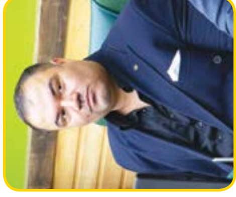
۲ مشهد میزبان اردوی تیم ملی کوراش