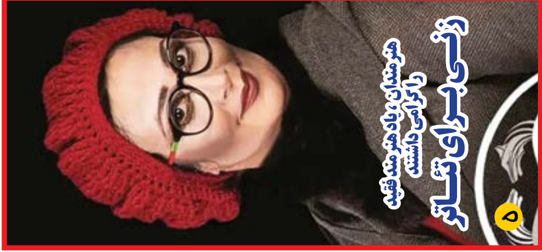
زن برای برابری تفاوت را کرامتی داشتند هنرمندان، یاد هنرمند فقید