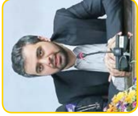
۷ فروش ۸ میلیاردی نمایشگاه «برای ایران»