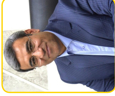
۷ مشهد میزبان مسابقات بین المللی جام اکو