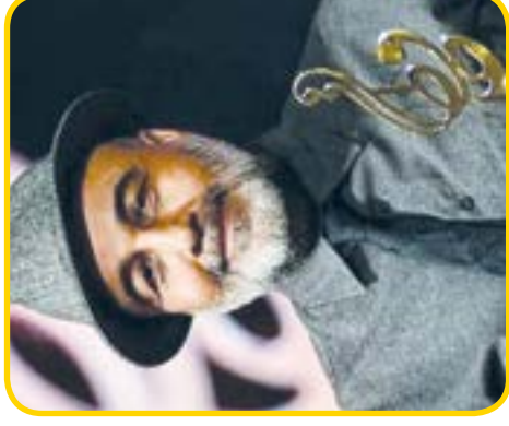
۶ رضا عطاران آنلاین می شود