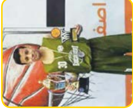
۲ نوظلانی آینده روشن بسکتبال کشور

• 9 January, 2025 • هفته نامه ورزشی و هنری • سال نهم • شماره ۴۳۴ • ۸ صفحه • ۸۰۰۰ تومان • پنجشنبه ۲۰ دی ۱۴۰۳ • ۸ رجب ۱۴۴۶ • Telegram.me/Nakhostnewsir