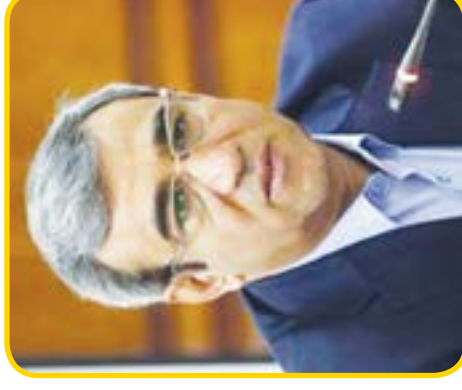
۳ قاب بیستم قاب طلایی ورزش !!