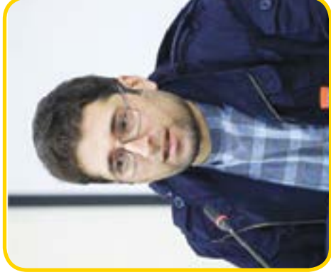
۷ چرا به هنرمندان وام نمی دهند؟!