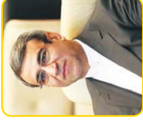
۳ قهرمانان، روسای هیات ورزشی شوند