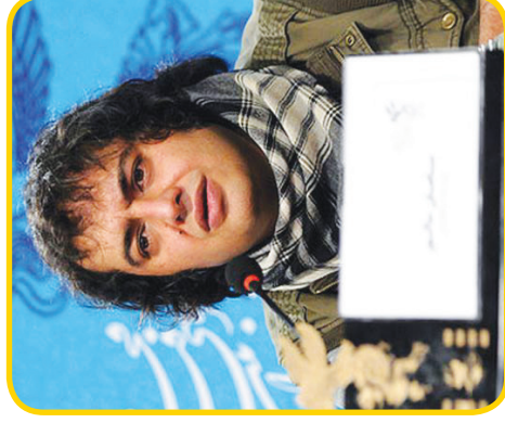
۶ چند پله بدتر از ماقبل مقوا