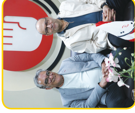
۴ پاشنه آشیل مدیریت ورزشی