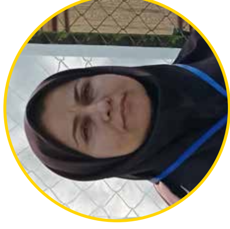
۳ آکادمی تیراندازی برای کمبینایان