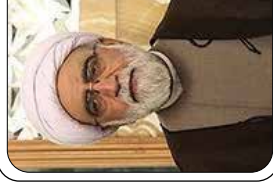
حرم رضوی حلقه وصل ایرانیان مقیم خارج