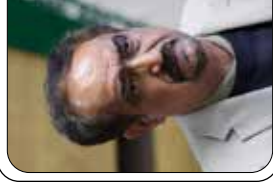
نخستین قلب مصنوعی در مشهد تپید