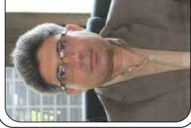
خراسان رضوی رنجه دوم کشور در تعداد تعاونی ها