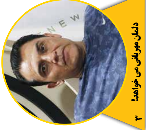
۳ دلمان مهربانی می خواهد!