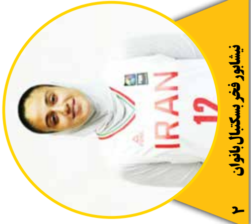
۲ نیشابور فخر بسکتبال بانوان