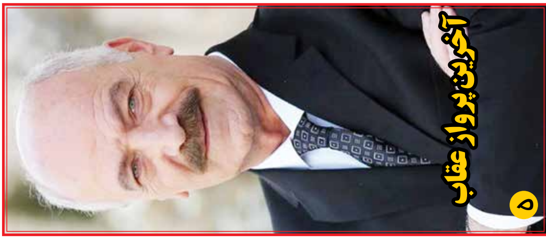
آخبرین پرواز عقاب