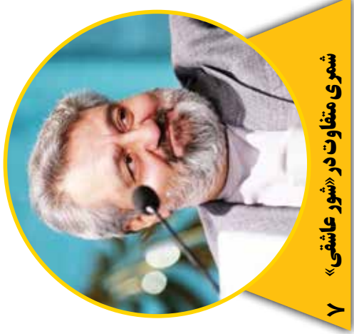
۷ شهری متفاوت در «شور عاشقی»