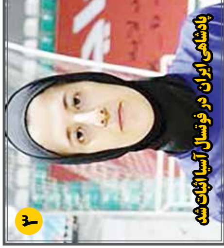
پادشاهی ایران در فوئسال آسیا اثبات شد