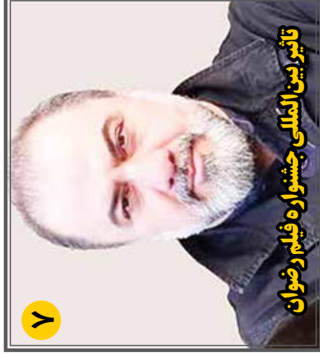
تأثیر بین المللی جشنواره فیلم رضوان

• 2 May, 2023 • هفته نامه ورزشی و هنری • سال هشتم • شماره ۸۰۲ • صفحه ۸۰۰۰ • تومان • پنجشنبه ۱۳ اردیبهشت ۱۴۰۳ • ۳۳ شوال ۱۴۴۵ • Telegram.me/Nakhostnewsir