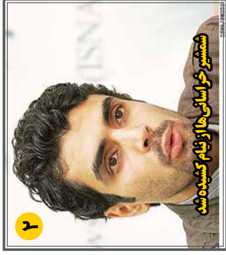
شمشیر خراسانی‌ها از نیام کشیده شد