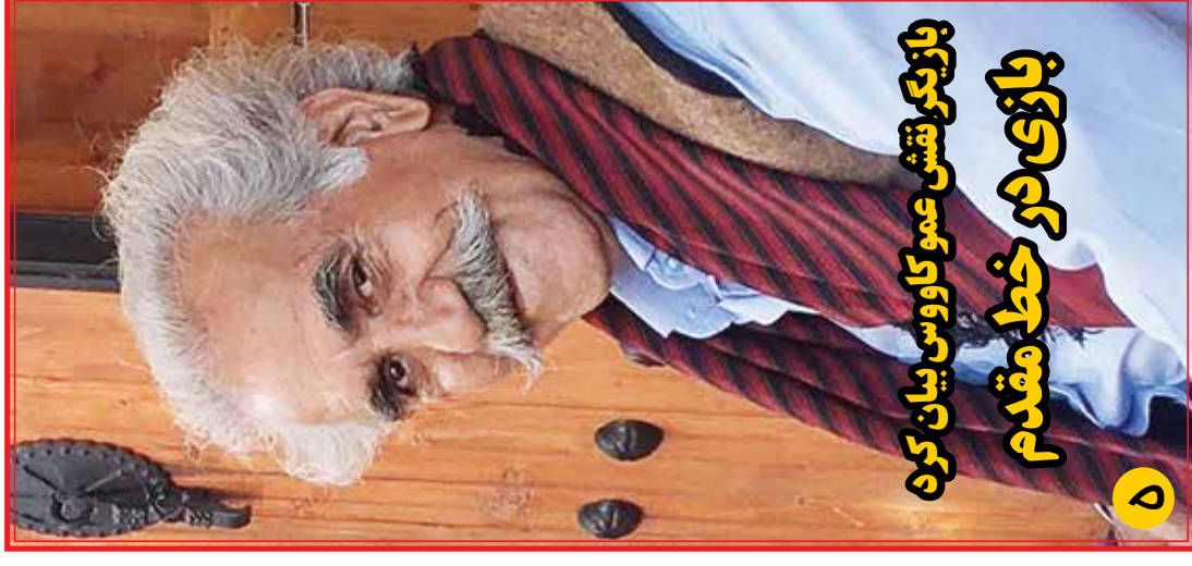
بازیگر نقش عمو کاووس بیان کردن بازی در خط مقدم