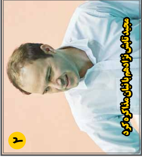
مجدد تاشی نژاد هم با نمایان مذاکره کرده