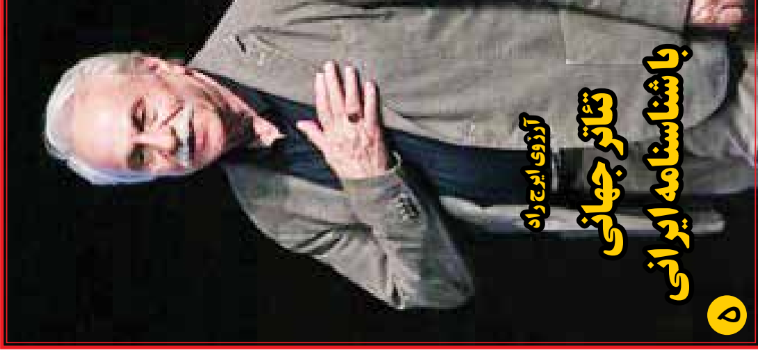
آرزوی ابوج راه