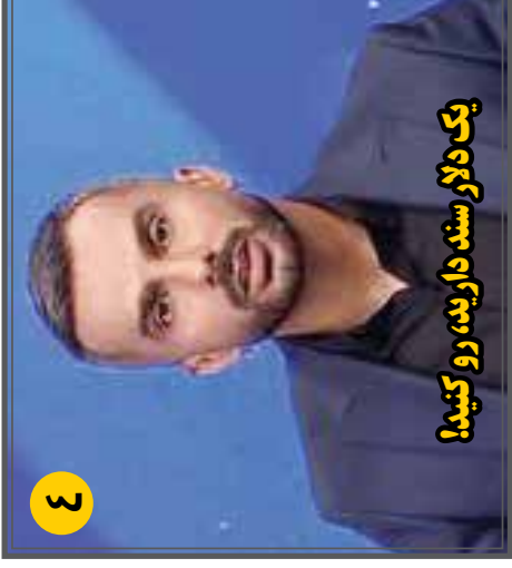
یک دلار سنده دارید، رو کنید!