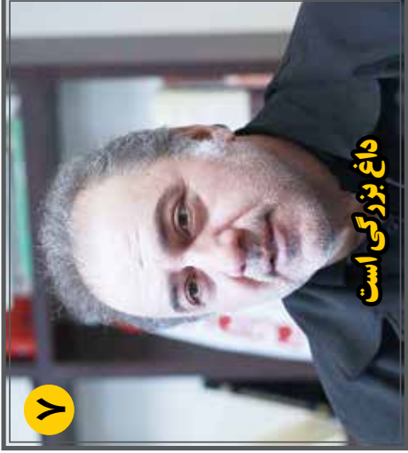
داغ بزرگی است