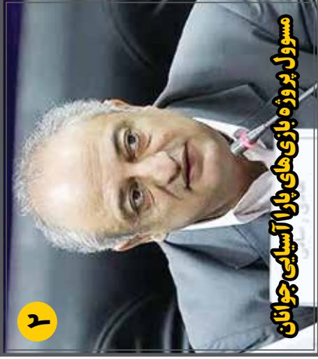
مسوول پروژه بازی های پارا آسیایی جوانان