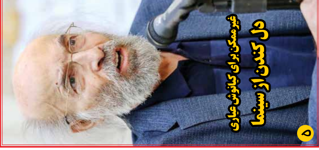
دل کندن از سینما غیر ممکن برای کیانوش عیاری