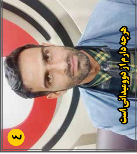
هر چه دارم از دو میدانی است