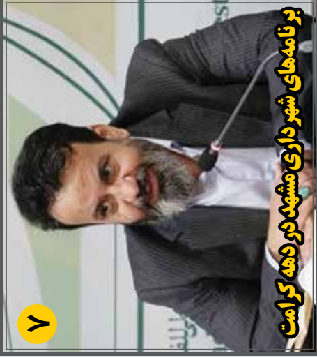
برنامه های شهر داری مشهد در دهه کرامت