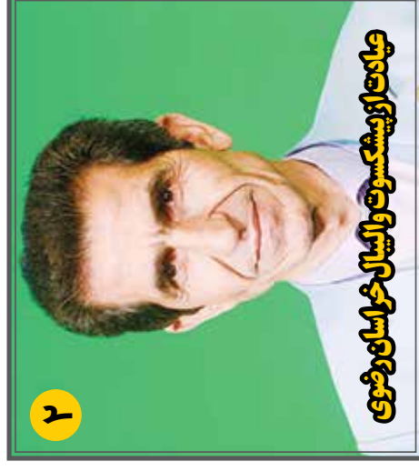
جانات ازبشکسوت و الیال خراسان رضوی