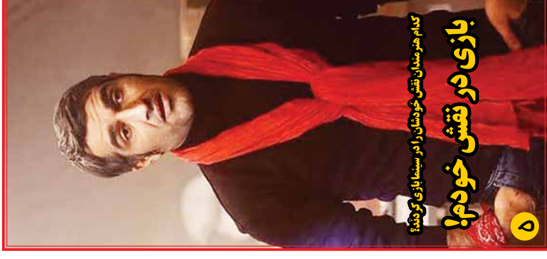
کدام هنرمندان نقش خودشان را در سینما بازی کردند؟ بازی در نقش خودم!