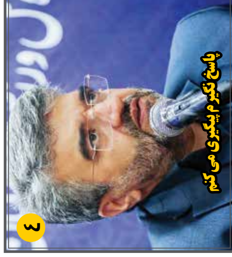
پاسخ نگیر م پیگیری می کنیم