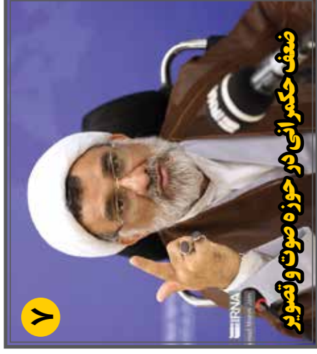
ضعف حکمرانی در حوزه صوت و تصویر