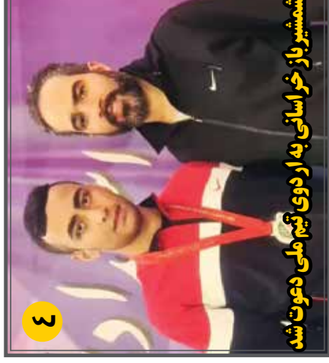
شمسباز خراسانی به اردوی تیم ملی دعوت شد