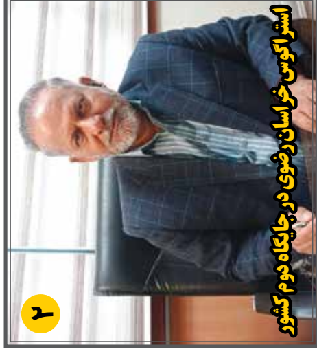
استراکوس خراسان رضوی در جایگاه دوم کشور