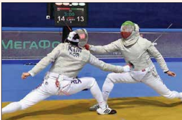
به اردوی تیم ملی فلوره دعوت شد که از ۱۸ فروردین ماه اردوی تیم ملی برگزار شده است. وی افزود: طی سال هایی که در عرصه ورزش فعالیت کردم هرگاه