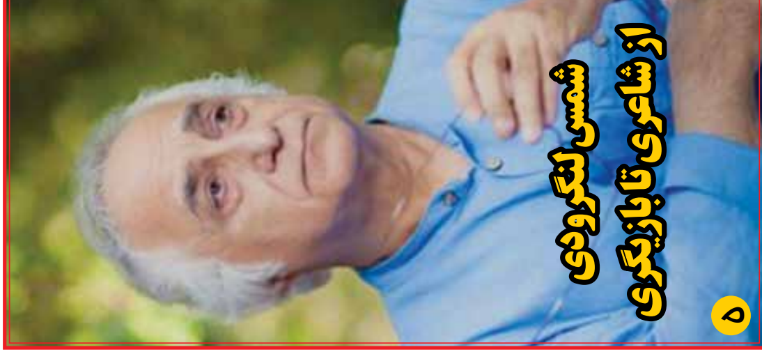
از شاعری تا بازیگری شمس لنگرودی