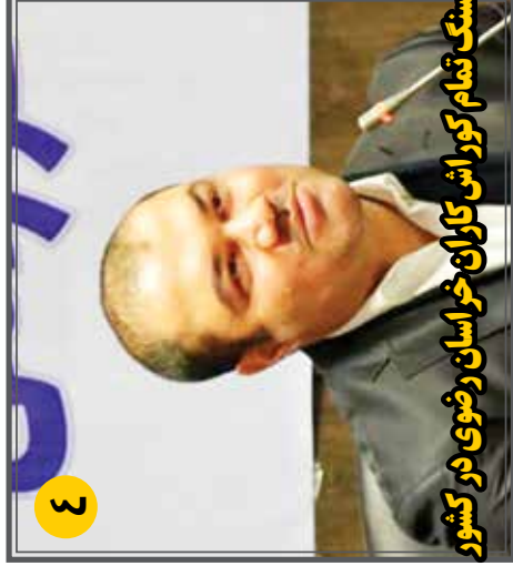
سنگ تمام کوراش کاران خراسان رضوی در کشور