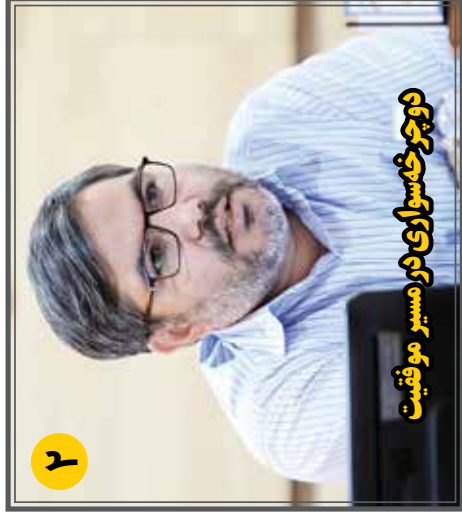
دوچرخہسواری در مسیر موفقیت