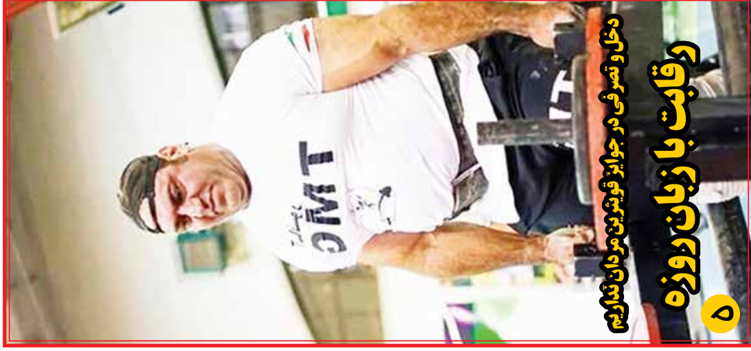
دخول و تصرفی در جوایز فوٹبیرین مردان تمارین