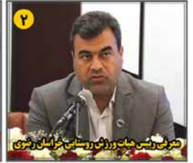
۲ معرفی رئیس هیات ورزش روستایی خراسان رضوی