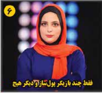
۶ فقط چند بازیگر بول سازه و دیگر هیچ

• هفته نامه ورزش و هنر • سال هشتم • شماره ۲۸۹ • ۸ صفحه • ۵۰۰ تومان • ۴ January 2023 • Telegram.me/Nakhostnewsir • پنجشنبه ۱۴ دی ۱۴۰۲ • ۲۱ جلدی تا به ۱۳۳۵