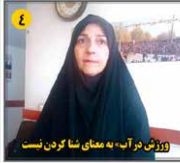
۴ ورزش در آب به معنای شنا کردن نیست