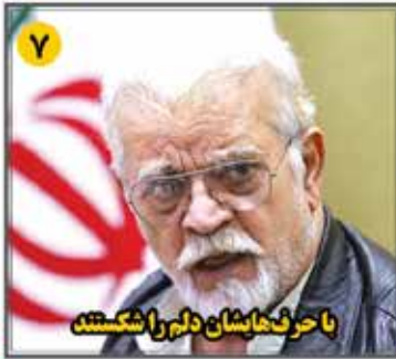
با حرف‌هایشان دلیر را شکستند