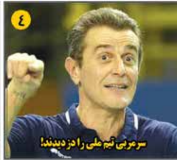
سر مربی تیم ملی را دزدیدند!