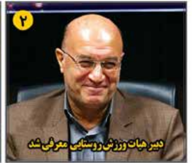
دبیر هیات ورزش روستایی معرفی شد