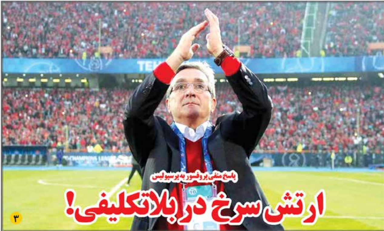
باسخ منفی پر فیسور به پرسپولیس