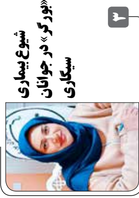
شیوع بیماری «بورگر» در جوانان سیکاری