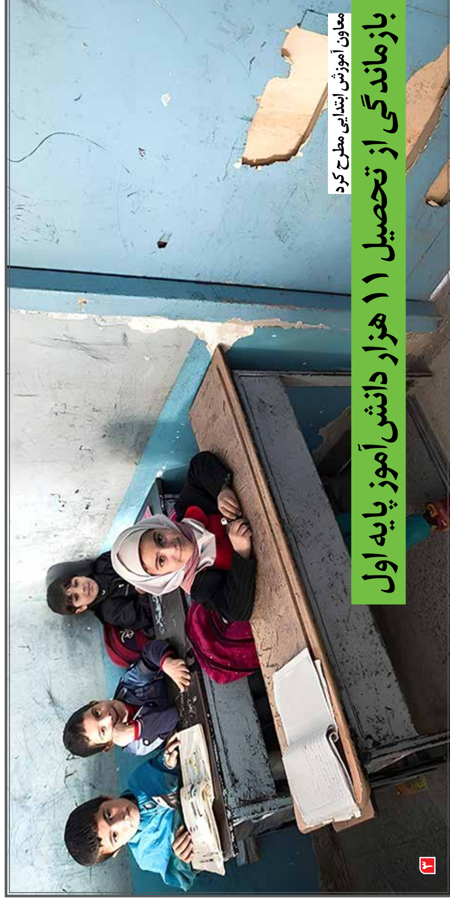
معاون آموزش ابتدایی مطرح کرد

بازماندگی از تحصیل ۱۱ هزار دانش‌آموز پایه اول