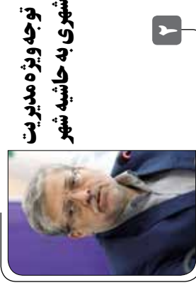
توجه ویژه مدیریت شهری به حاشیه شهر