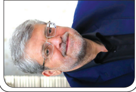
مشهد با بروت شد