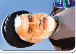
تقدیر صدا و سیما از موسسه اعتباری ملی