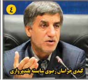
کدی خراسان رضوی شایسته بلندی‌پروازی