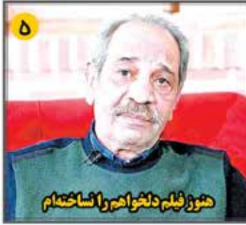
هنوز فیلم دلخواهم را نساختم

• هفته نهم ورزش و هنر • سال هشتم • شماره ۸ • صفحه ۵۰۰۰ • ۱۴۰۲ • پنجشنبه ۲۳ آذر ۱۴۰۲ • ۳۰ جمادی الاولی ۱۴۲۵ • 14 December 2023 • Telegram.me/Nakhostnewsir