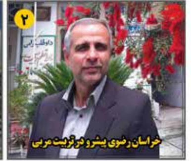
خراسان رضوی پیشرو در تربیت مربی