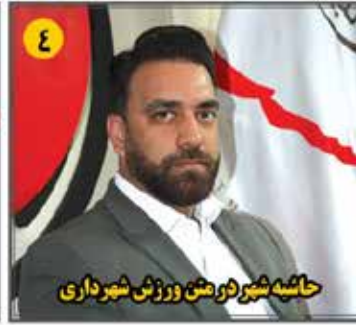
حاشیه شهر درخش ورزش شهرداری