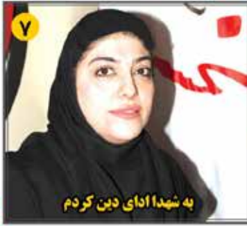
به شهدا ادای دین کردم

• هفته نامه ورزش و هنر • سال هشتم • شماره ۲۸۲ • ۸ صفحه • ۵۰۰۰ تومان • 30 September 2023 • پنجمین شماره ۹ آذر ۱۴۰۲ • ۱۶ جمادی الاولی ۱۴۲۵ • Telegram.me/Nakhostnewsir