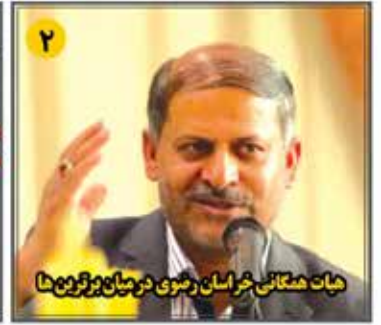
هیات همگانی خراسان رضوی در میان ورزشی ها