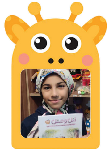
حلما كيميائي از تهران