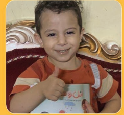
ابا الفضل زید الخفاجی از بغداد