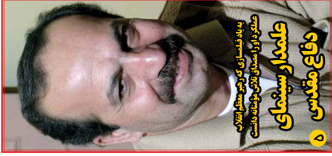
به یاد فیلمسازی که رهبر معظم انقلاب عملکرد او را مصداق تلاش مؤمنانه دانست