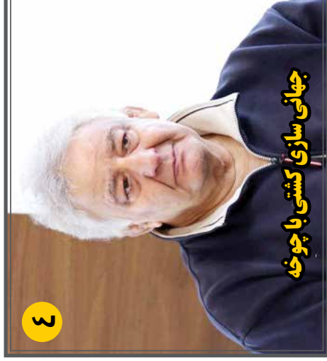
جهانی سازی کشتی با چوخه