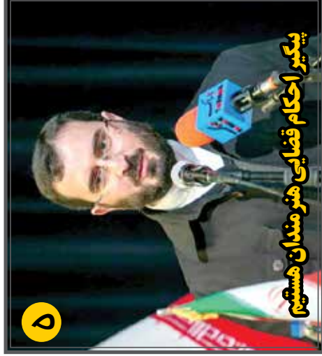
پیگیر احکام قضایی هنرمندان هستم