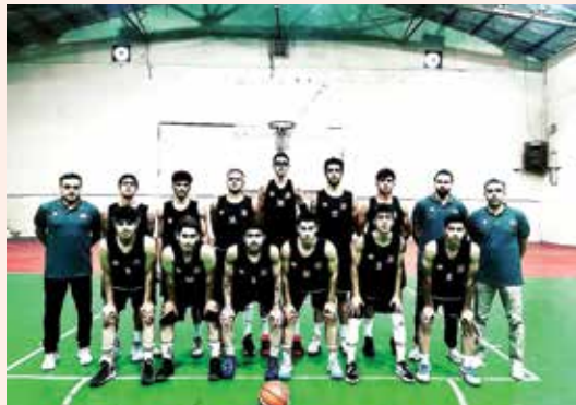
استان در لیگ جوان کشور حضور خواهد داشت و این مسابقات به منظور کسب آمادگی بیشتر برای حضور شایسته در رقابت های کشوری است.