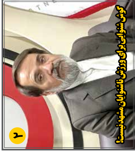
کوش شنوایی برای ورزش ناشنوایان مشهود نیست!