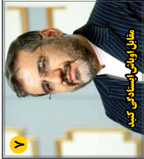
مقابل او باش ایستادگی کنید

• 6 July 2023 • هفتده نامه ورزشی و هنری • سال هشتم • شماره ۸۰۳۶۴ • صفحه ۵۰۰۰ • تومان • پنجمینده ۱۵ تیر ۱۴۰۲ • ۱۷ ذی الحجه ۱۴۴۴ • Telegram.me/Nakhostnewsir