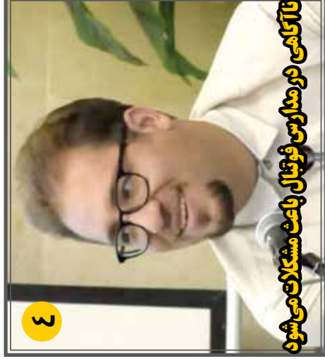
ناآگاهی در مدارس فوتبال باعث مشکلات می شود