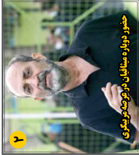
حضور دوباره میثاقیان در عرصه مربیگری