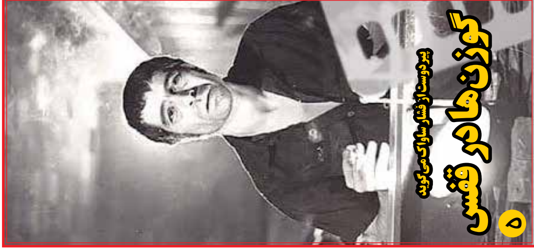
بیرونست از فشار ساواک می گویند