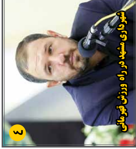
شهر داری مشهد در راه ورزش قهرمانی