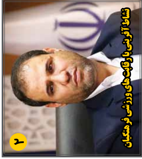
نشاط آفرینی با رقابت های ورزشی فرهنگیان