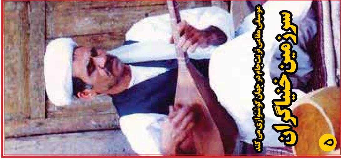
موسیقی مقامی تریب جام در جهان کوشواری می کند