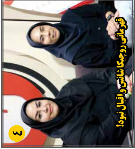
قیومانی روچیکا شانس و اقبال نبود!