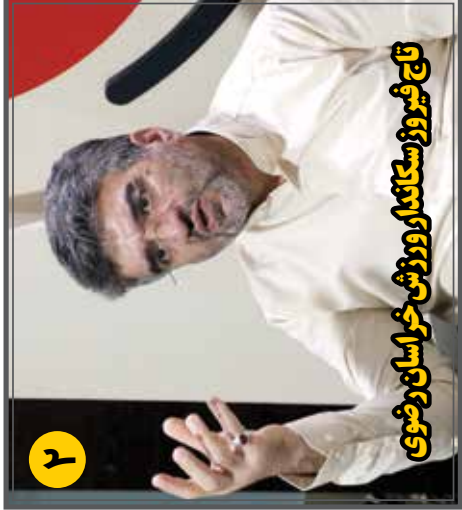
تاج فیروز سگانداری ورزش خراسان رضوی