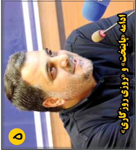
ادامه «پایتخت» و «روزی روزگاری»