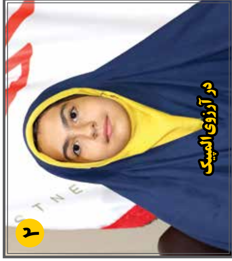
دور آرزوی المیدیک