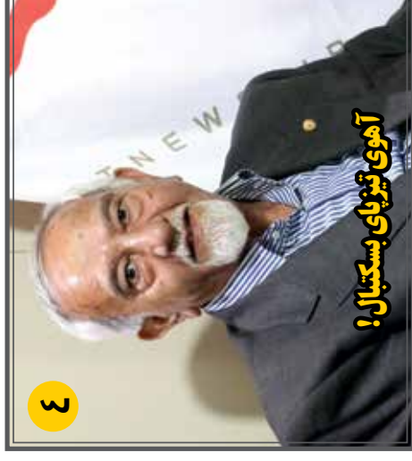
آهوی تیرنای بسکتبال!