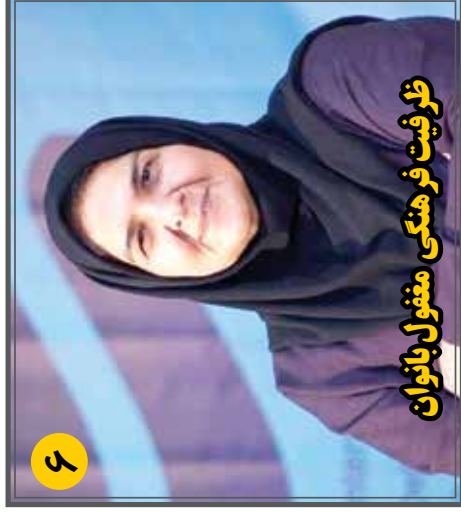
ظرفیت فرهنگی مغفول بانوان