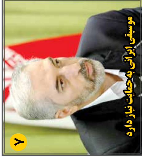
۷ موسیقی ایرانی به حمایت نیاز دارد