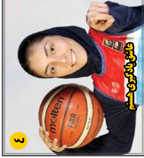
۳ عاشق یادگیری هستم