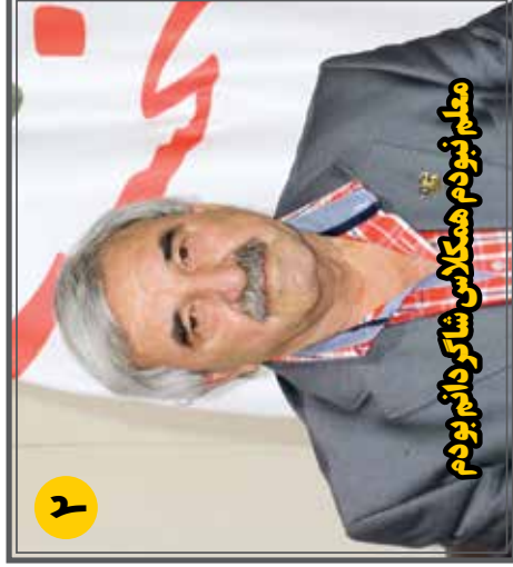
۲ معلم نبودم همکلاس شاکر دائم بودم