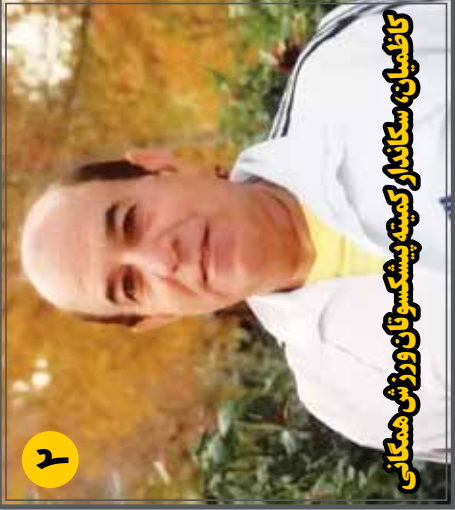
کامپلیان، سگانداز کمیٹی پیشکوتان و ورزشی همگانی