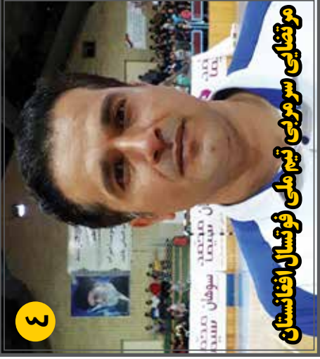
مربی نصابی سو مریبی ٹیم ملی فوٹسال افغانستان