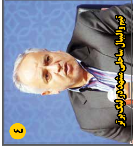
تیم و الیال ساحلی مشهد در لیگ برتر