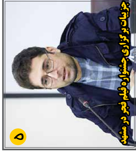
جوزیات بر گزار چی جشوار ه فیلم فجر در مشهد