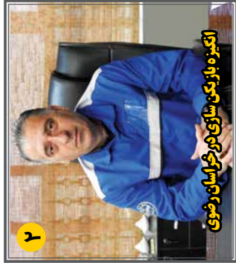
انگیزه باز یکن ساز چی در خراسان رضوی