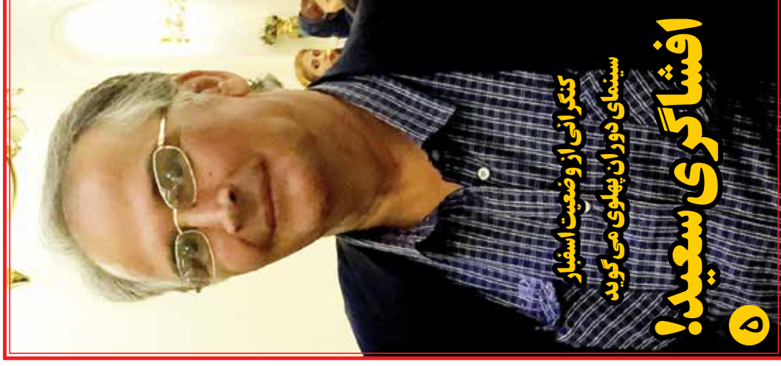
کنگرانی از وضعیت اسفبار سینمای دوران پهلوی می گوید