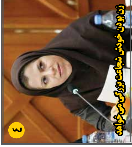
زن یون خودش شجاعت بزرگی می خواهد