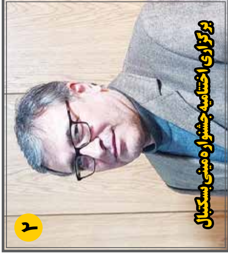
پزشک زاری اختتامیه جشنواره مینی بسکتبال