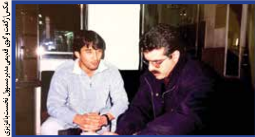
عکس از گفت و گو قدیمی مدیرمسئول نخست با مربی

میرسلو بلاژیویچ، سرمربی کروات سابق تیم ملی چهارشنبه گذشته در سن ۸۸ سالگی درگذشت. خداداد عزیز، یکی از اعضای تیم ملی در زمان بلاژیویچ بود که مدتی پس از حضور او از تیم ملی خداحافظی کرد. با او در خصوص درگذشت بلاژیویچ گفتگویی داشتیم که در ادامه می خوانید: