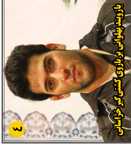
بازویند پهلوانی بر باروی کشتی گیر خراسانی