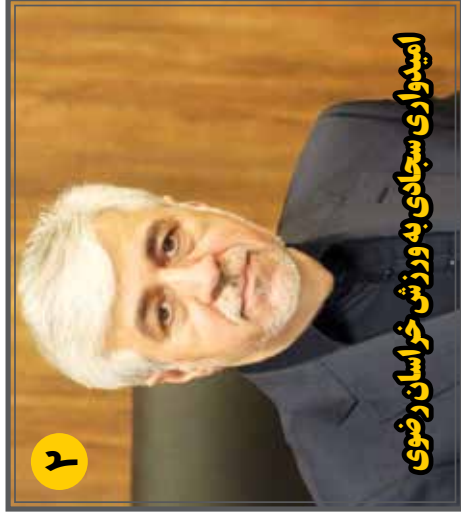
امیدواری سجادی به ورزش خراسان رضوی