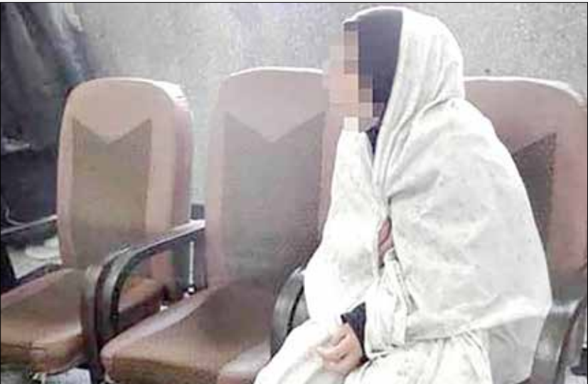
عکس از پیشانی است

امام رضا (ع) شوهرم خود را متوقف کرد و پیکر او را در حاشیه خیابان رها کردیم و سپس با جمع‌آوری لوازم شخصی راهی تهران شدیم. در آنجا خانه‌ای را اجاره کردیم تا برای همیشه و با فروش طلاهای سرقتی که چندین میلیارد تومان می‌ارزید در رفاه و آسایش زندگی کنیم اما مدتی بعد وقتی فهمیدیم که کسی متوجه ماجرای سرقت نشده است برای انتقال بقیه لوازم زندگی به مشهد آمدم که ناگهان در محاصره کارآگاهان پلیس آگاهی مشهد قرار گرفتیم و دستگیر شدیم. اینجا بود که فهمیدم شوهر و پیکر نیمه‌جان دوستم را در حالی به بیمارستان امام رضا (ع) منتقل کرده‌اند که او نفس‌های آخر زندگی‌اش را می‌کشید و ۳ روز در حالت اغما با مرگ دست‌وپنجه