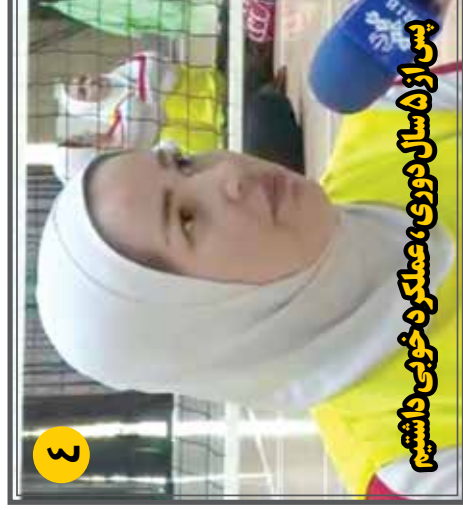
پس از ۵ سال دوری، عملکرد خوبی داشتیم