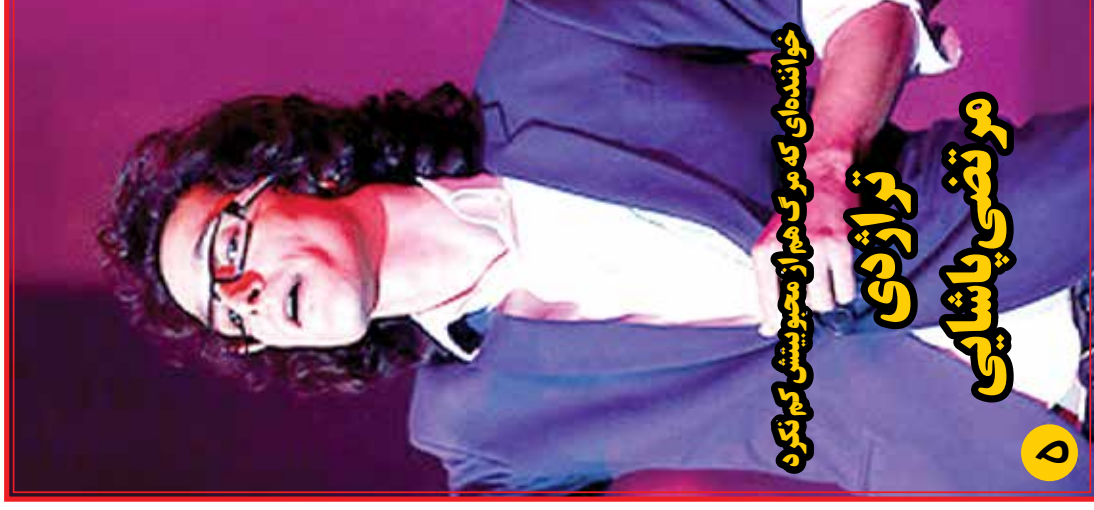
خواننده‌ای که مرگ هم از محبوبیتش کم نکرد