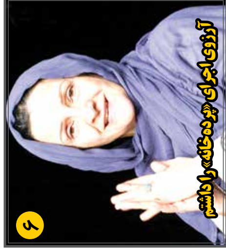
آرزوی اجرای «پرده خانه» را داشتیم