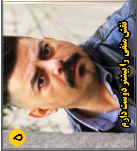
نقش منفي را پيشتر دوست دارم