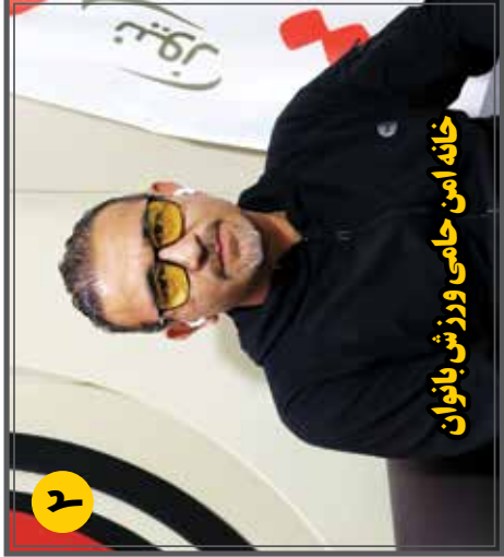
خانه امن حامی ورزش بانوان