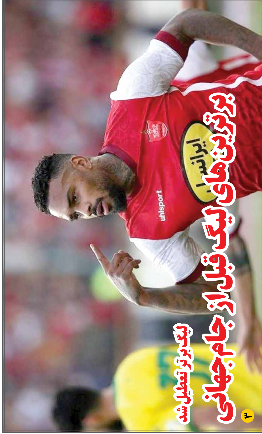
لیگ برتر تعطیل شد