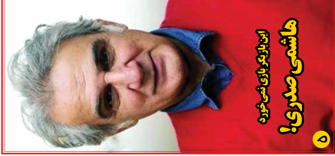
این بازیگر بازی نمی خورد هاشمی صدوری!