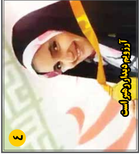
آرزويم ديوار و هيرو است