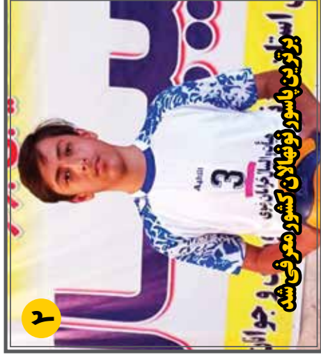
تزیق در دوسر در مسابقات جهانی