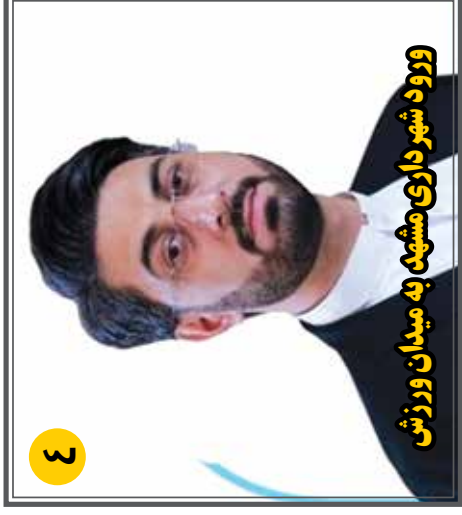
وزود شهر داری مشهد به میدان ورزشی