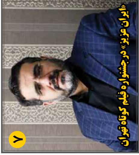
«ایران عزیز» در جشنواره فیلم کوتاه تهران