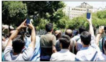
باز شدن پای غیر سیاسی‌ها

بررسی جنس و طیف کاربران شبکه‌های اجتماعی در اعتراضات اخیر نشان می دهد که ۳۷/۳ درصد کاربران که در باره اعتراضات اخیر تولید محتوا کرده‌اند پیش‌ازاین غیرسیاسی بودند و بعد از اتفاقات اخیر پایشان به تولیدات سیاسی باز شده است که این می تواند دلایل مختلفی داشته باشد. از جمله تحریک احساسات و عواطف عمومی برای اتفاق تلخ پیش آمده. مخالفت با گشت ارشاد که پیش‌ازاین بارها در باره مخالفت و اشتباهات آن در محافل خبری گفته شده. همچنین تهییج کاربران پرفالوور و فعال نیز یکی از رفتارهای موثر در شبکه اجتماعی بوده است. در کنار این کشف حجاب برخی هنرمندان نیز برداشت ماجرا اضافه کرد. همچنین طیف سلبریتی‌ها و چهره‌های مختلف در اعتراضات اخیر گسترده‌تر بود و بررسی محتواهای منتشر شده از سوی آن‌ها نشان می دهد. شکل بسیار رادیکال‌تری نسبت به اعتراضات گذشته داشته است. به طوری که بسیاری طوری رفتار کردند که گویی دیگر به حضور و کار در ایران هیچ احتیاجی ندارند و در همین راستا دیگر همکارانشان را نیز تهییج به اعلام موضع‌های رادیکال و تند می کردند. ۱۰ محتوای علی کریمی در بازه زمانی ذکر شده حدود ۱۹ میلیون بازدید داشته است. در آخرین مورد نیز احسان کریمی که در آمریکا حضور داشت با تولید محتواهای مختلف به هنرمندان و حتی پیشکسوتان هنری کشور تاخت و از همکارانش دعوت به همراهی می کرد تا اینکه با حضورش در شبکه من و تو رسماً کار در ایران را برای خودش پایان داد.