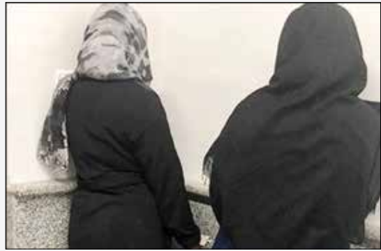
پنهان این جنایت صورت گیرد. زنی غریبه‌ای در واتس‌آپ شروع شد که دامنه آن به درگیری کشید.

ساعتی بعد دو متهم پرونده به پلیس آگاهی خراسان رضوی منتقل شدند و بازجویی از آنان زیر نظر سرهنگ مهدی سلطانیان (رئیس اداره جنایی آگاهی) آغاز شد و آن‌ها ابعاد دیگری از این جنایت تکلیف دهنده را فاش کردند اما باز هم هر کدام از متهمان سعی داشتند به خاطر مسایل عاطفی ارتکاب قتل را به گردن بگیرند. در حالی که دختر جوان به قتل پدرخوانده‌اش اعتراف کرده بود، مادر وی مدعی شد که ناگهان با کارد ضربتی بر پیکر و خودکشی کرد.