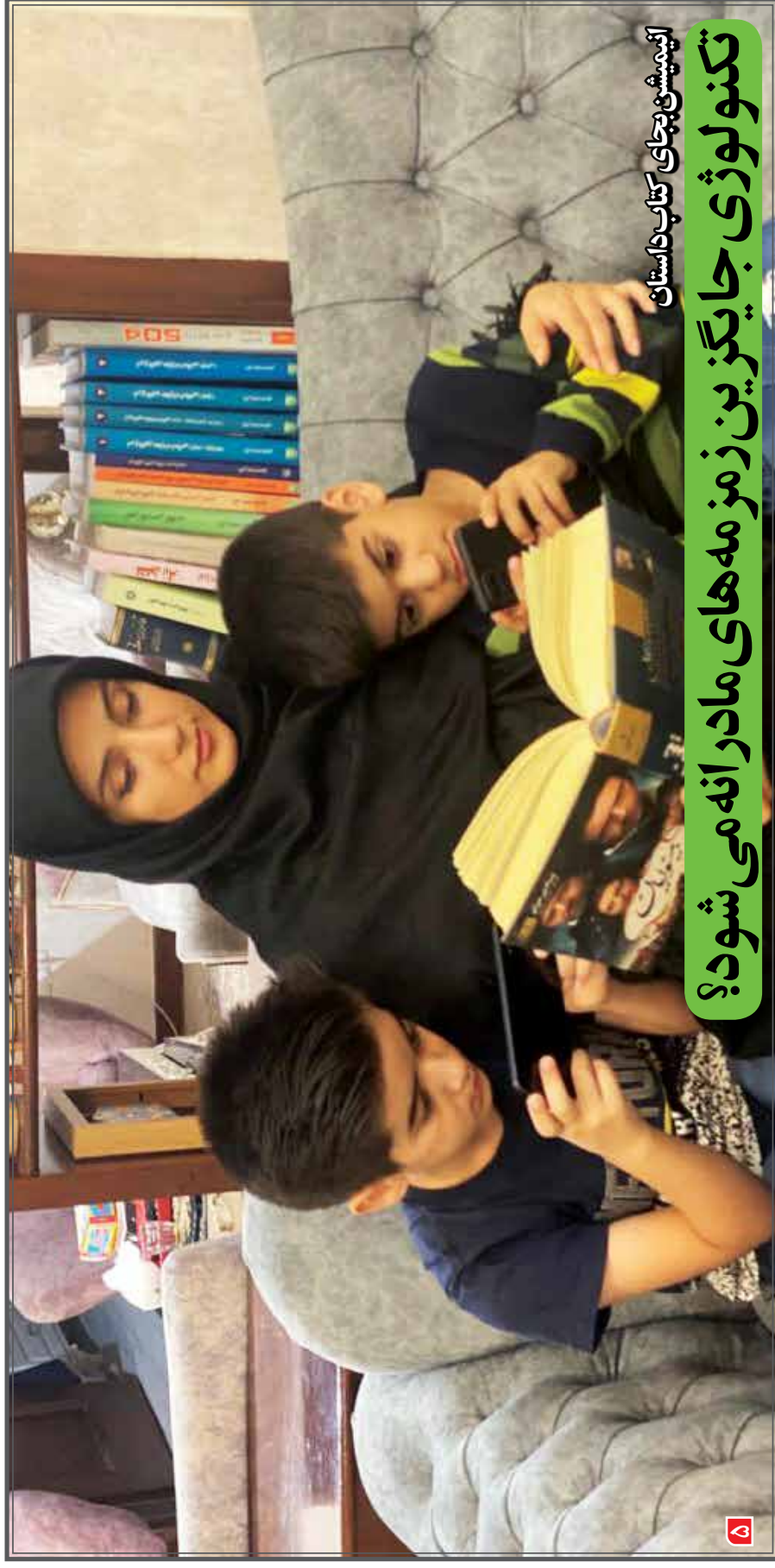
آبیمیشن بجای کتاب داستان

تکنولوژی جایگزین زنده‌های مادران می‌شود؟