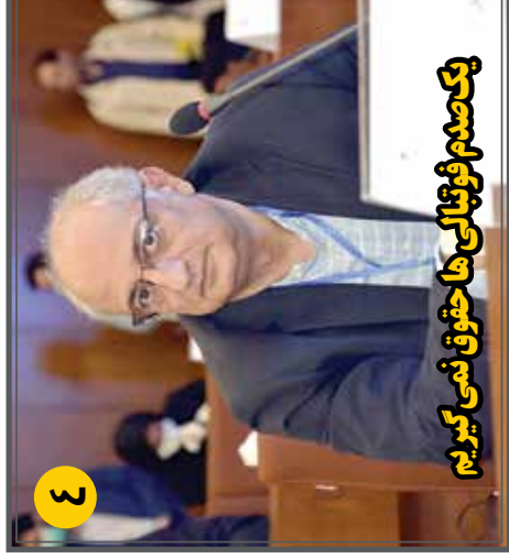
یک صدم فوتبالی ها حقوق نمی گیریم