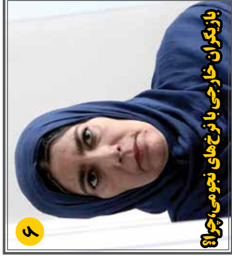
بازیگران خارجی با نرخ های نجومی، چرا؟