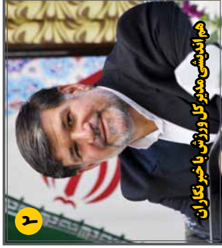
هم اندیشی مدیر کل ورزش با خیر نگاران