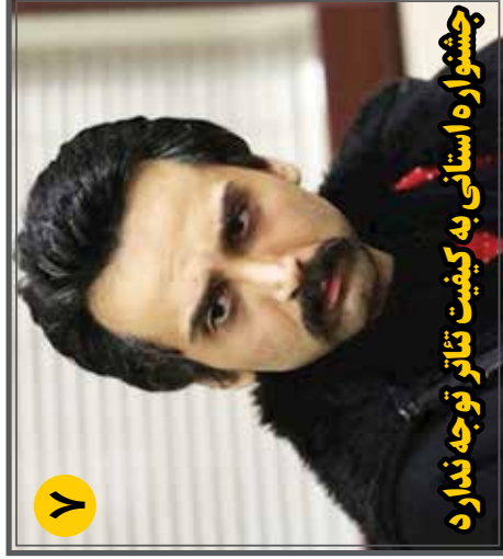
چشواره استانی به کیفیت تئاتر توجه ندارد