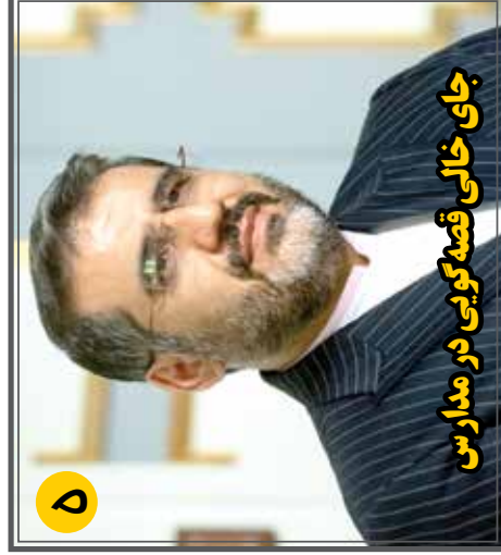
جای خالی قصه‌گویی در مدارس