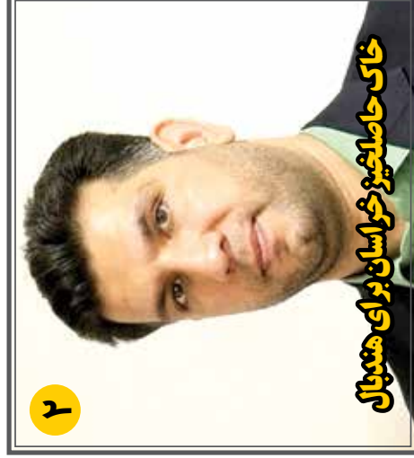
خاک حاصلخیز خراسان برای هندبال