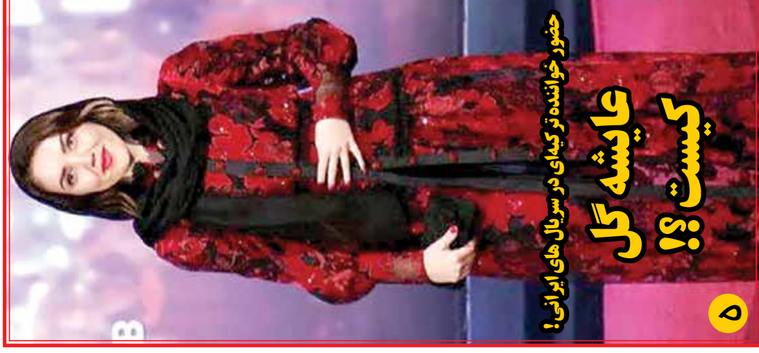
حضور خواننده تریپه‌ای در سریال های ایرانی!