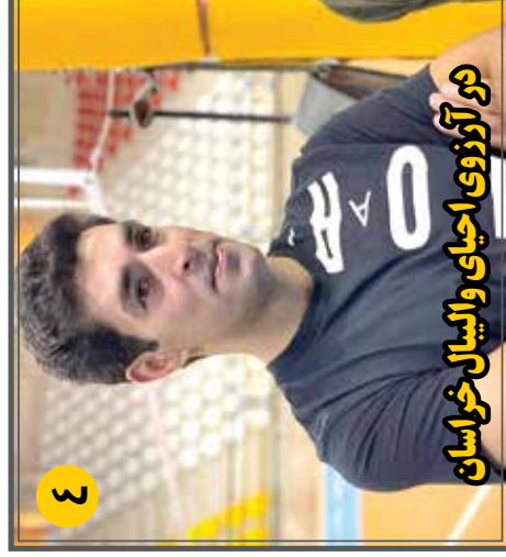
دور آرزوی احیای والیبال خراسان