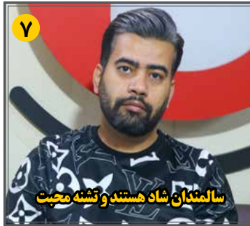
سالمدان شاد هستند و تشنه محبت