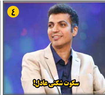
سکوت شکنی عادل!