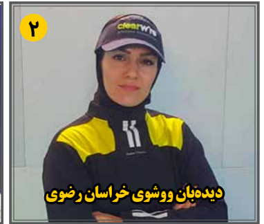
دیدهبان ووشوی خراسان رضوی