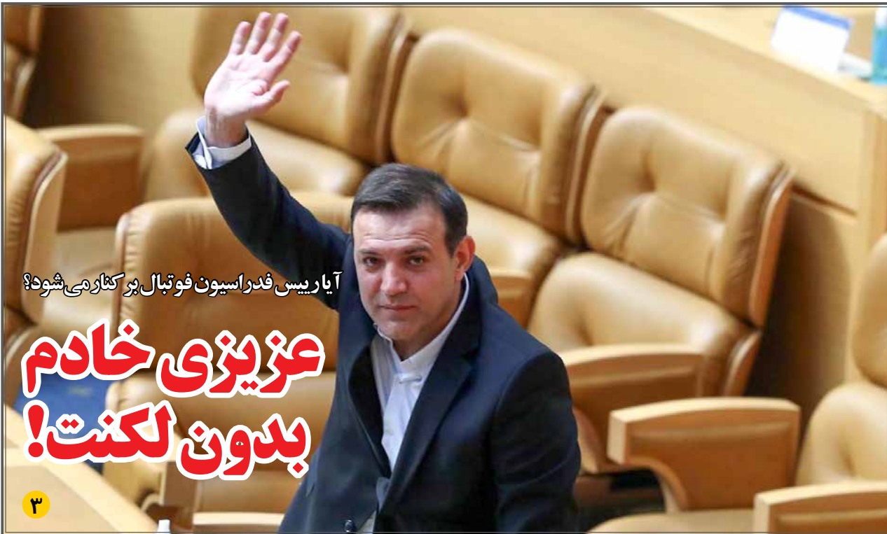
آیا رییس فدراسیون فوتبال پروکنار می‌شود؟