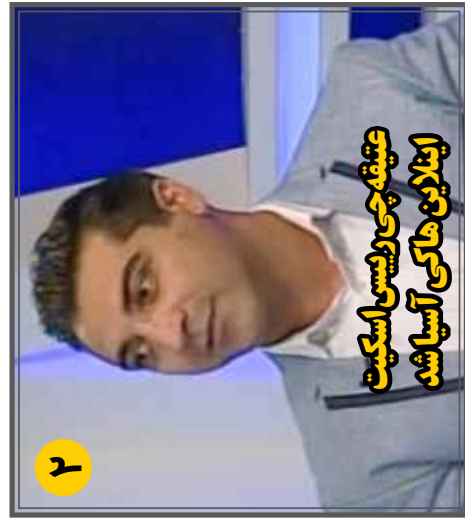
عفتقه چی رئیس اسکیت اینلاین هاکی آسیا شد