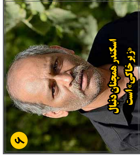
اسکندر همچنان دژبال «زیر خاکی» است