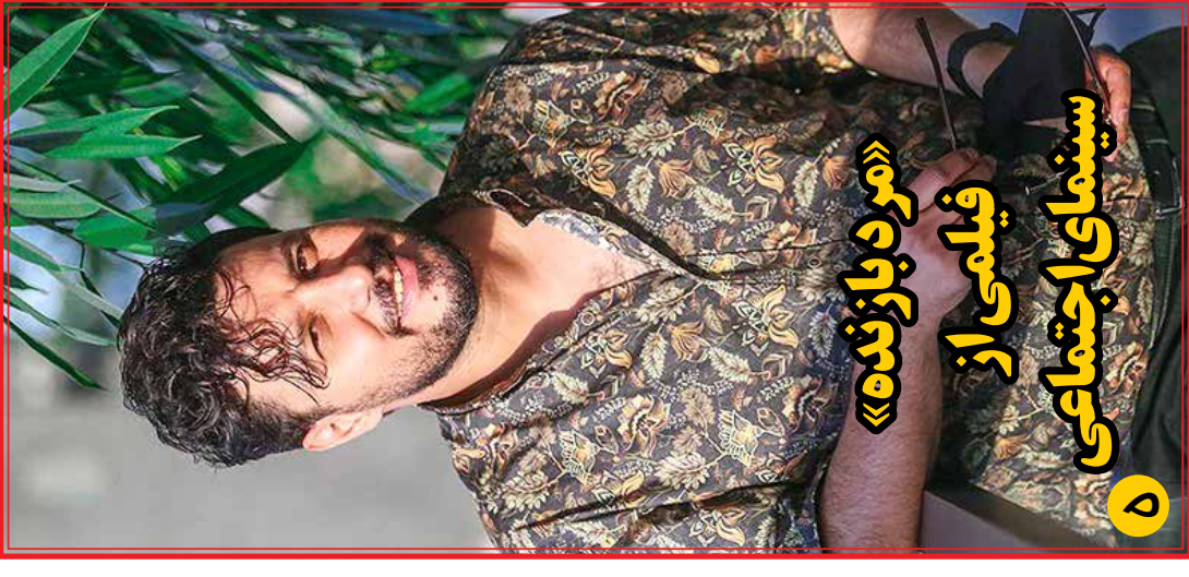
«مرد بارزنده» فیلمی از سینمای اجتماعی