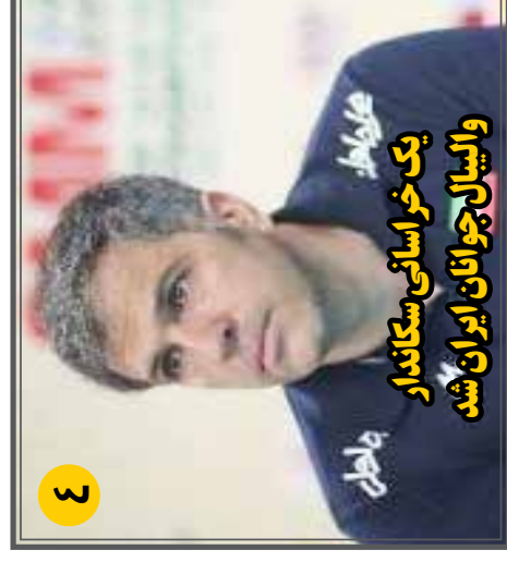
یک خراسانی سکندار والیبال جوانان ایران شد