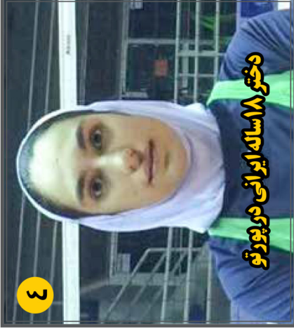
دختر ۱۸ ساله ایرانی در پورتو