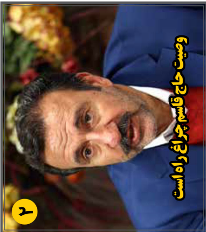
وصیت حاج قاسم چراغ راه است