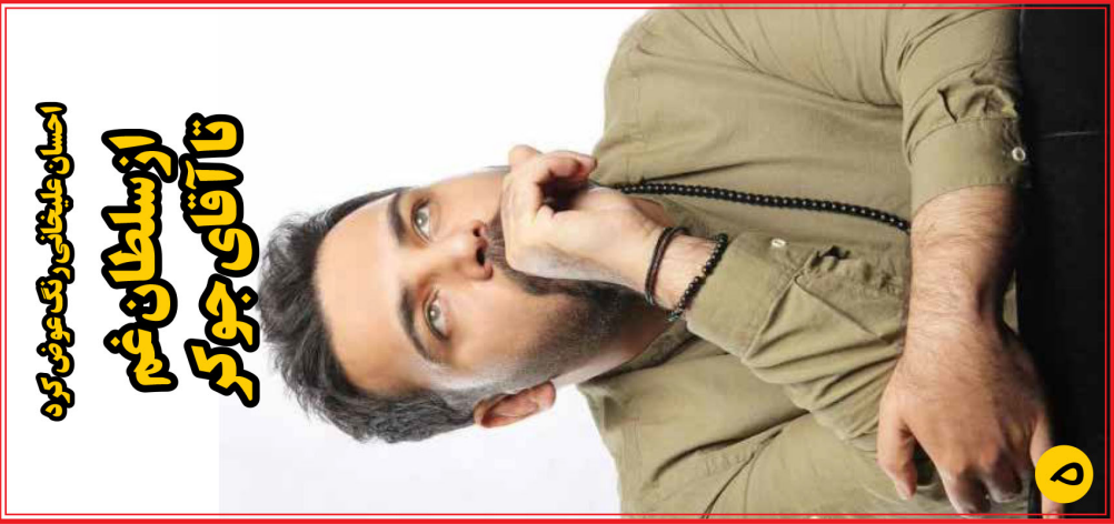
احسان علیخانی رنگ عوض کرد تا آقای جوکر از سلطان عم